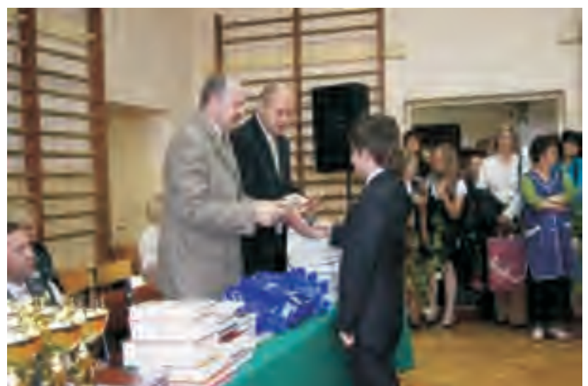
Na zdjęciu: uroczystość zakończenia roku szkolnego