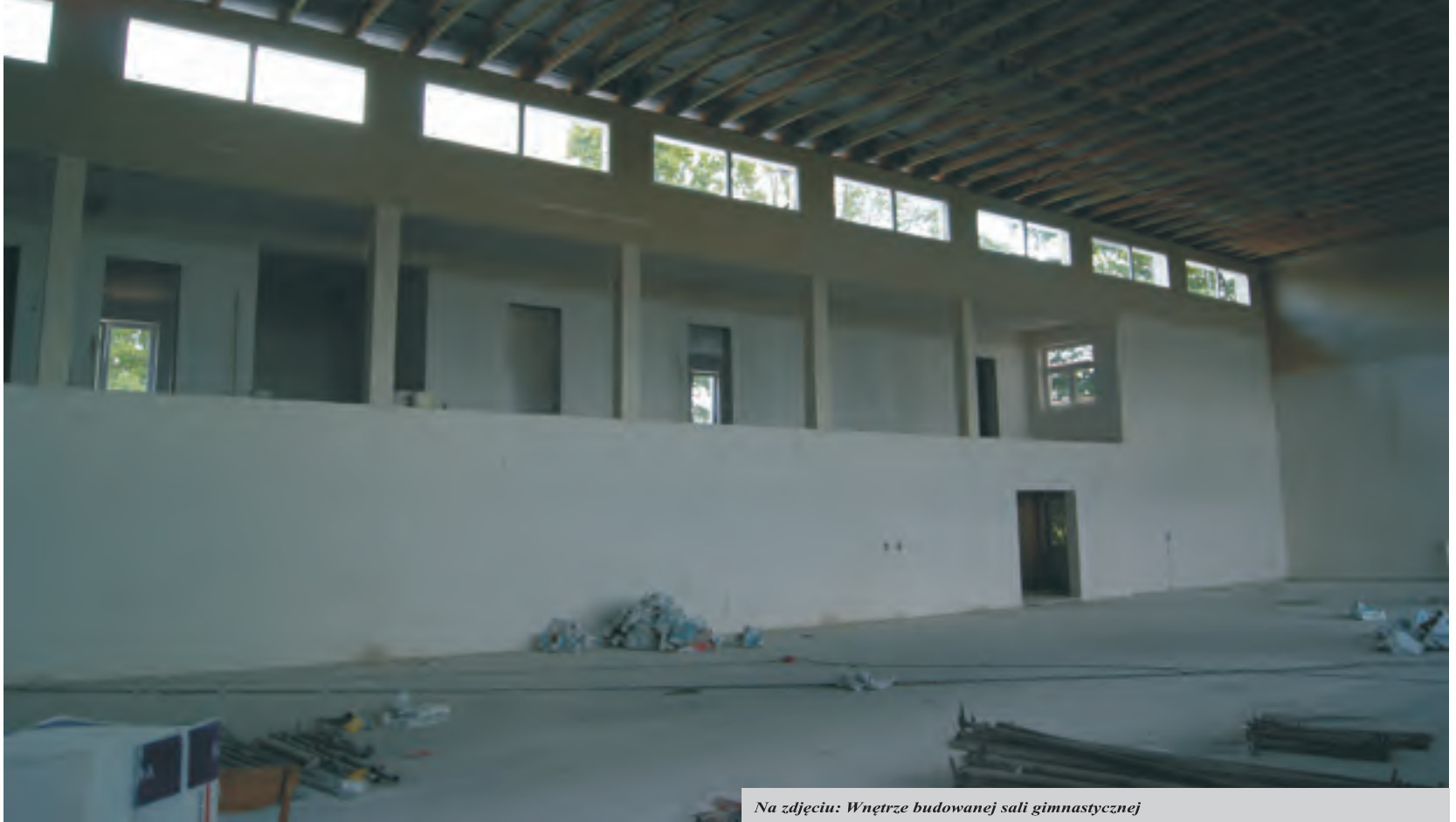
Na zdjęciu: Wnętrze budowanej sali gimnastycznej

Wiele emocji budzi budowa sali gimnastycznej przy Miejskim Zespole Szkół w Raciążu. To, że jest potrzeba budowy obiektu to chyba nikt nie ma wątpliwości.