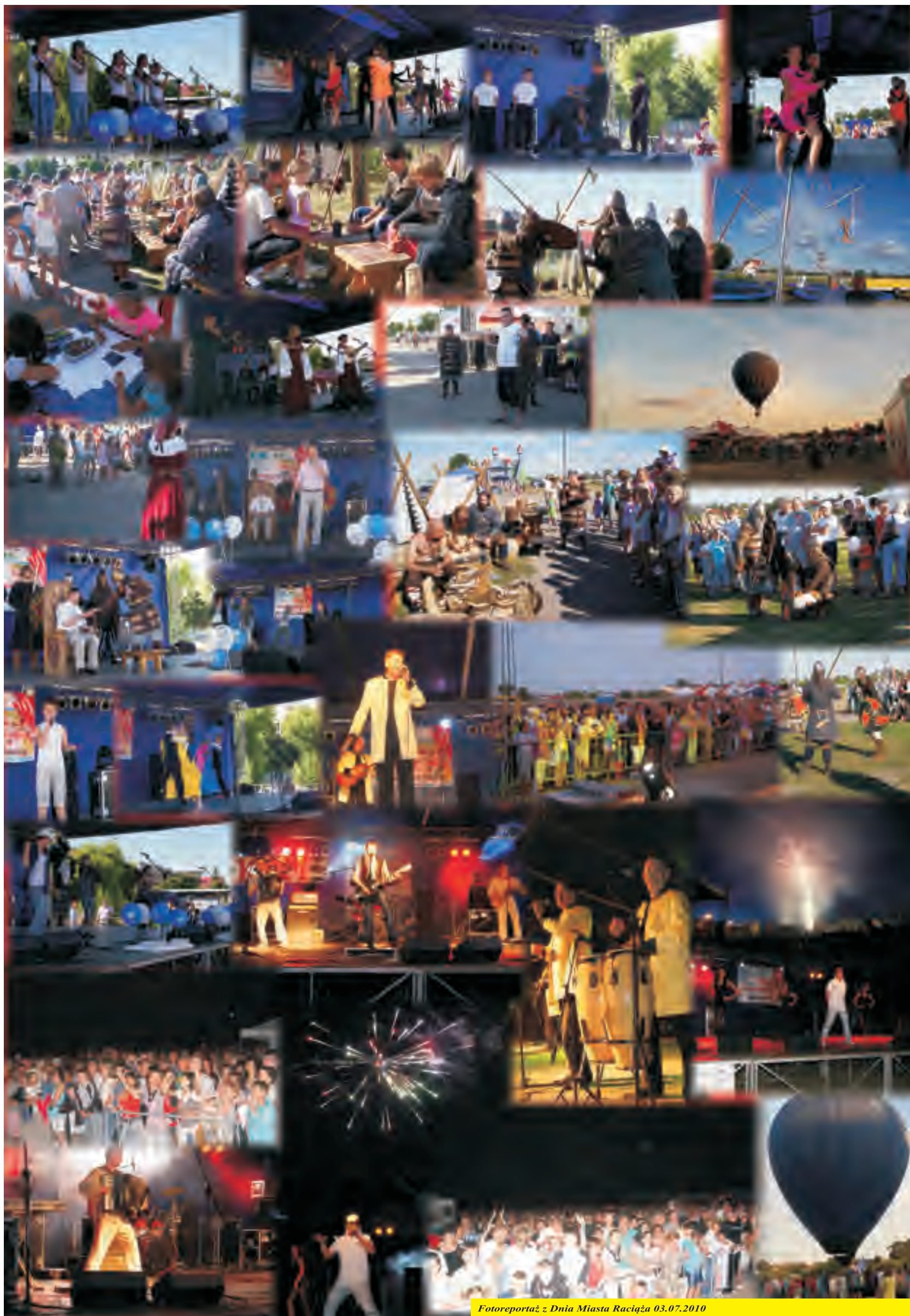
Fotoreportaż z Dnia Miasta Raciąża 03.07.2010