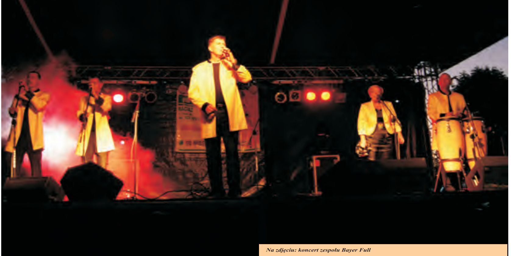
Na zdjęciu: koncert zespołu Bayer Full