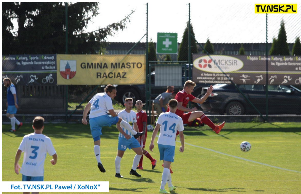
Fot. TV.NSK.PL Paweł / XoNoX"